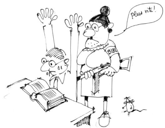
Dessin Olivier Callot, mars 1991